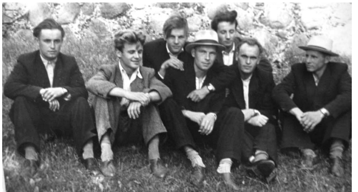
Kunigiškių kaimo vyrukai apie 1960 metus Marijos Magdalenos atlaiduose Vyžuonose.