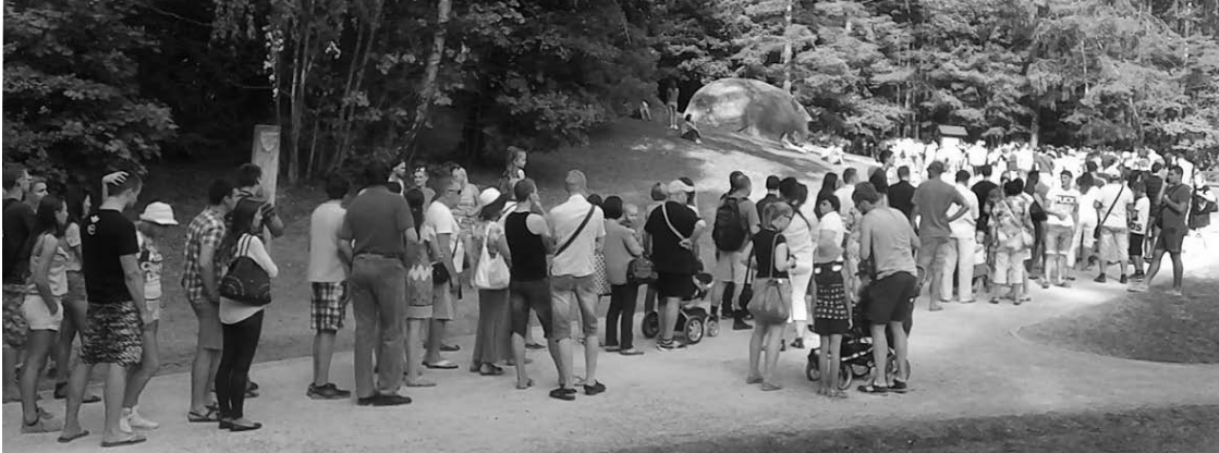
Eilė prie Lajų tako kai kuriems priminė Lenino mauzoliejaus aplankymą.

Šis savaitgalis mums, anykštėnams, buvo sunkus, bet išgyvenome. Sutapo gražūs orai, Žolinė, vyko bardų festivalis. Tai sutraukė tokias minias, kokių Anykščiai dar nėra matę.